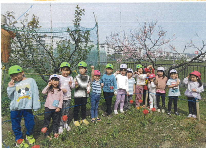
// ももとちゅうりっぷもさきたしよ //