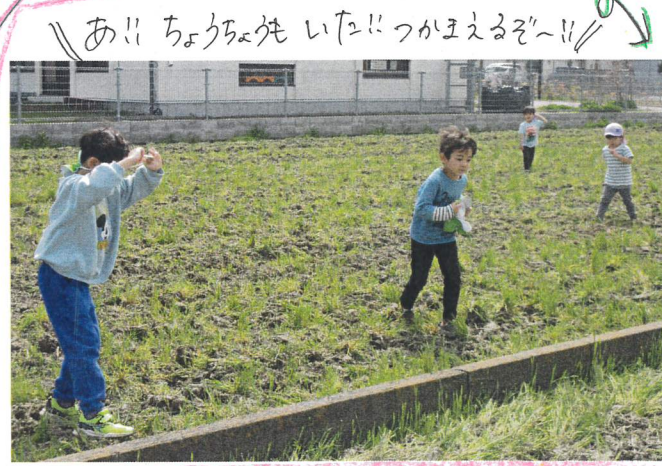
// あ!! ちゅうりっぷもいた!! つかまえるぞ!! //