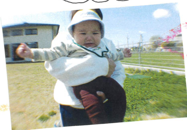
芝生が冷めたあ〜いる