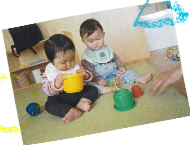
なにか入ってるかな？