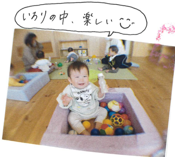
いろいろの中、楽しい♡