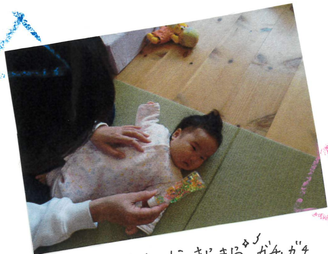
先生といっしょにきらきらがちゃがちゃ