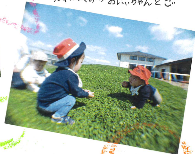
ふたばぐみのおいちゃんご