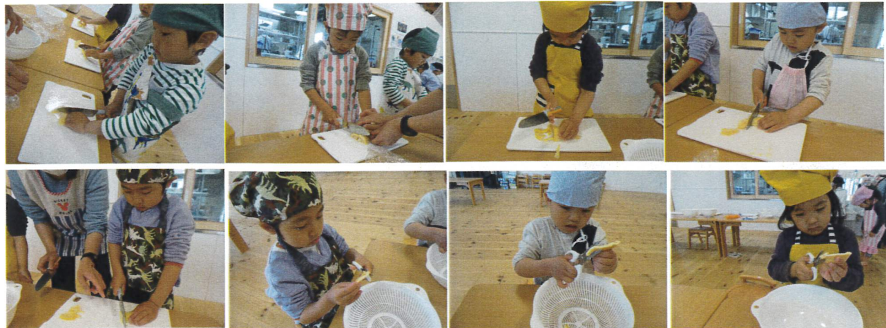
包丁やはさみを使って、食べやすい大きさに切ったよ。ねこの手(ガー)がんぼしたよ。