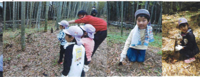
↑「あそこはたけのこがあるよ」