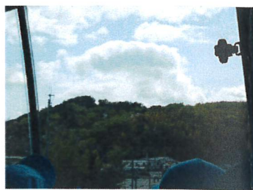
↑たけのこ山が見えてきたよ