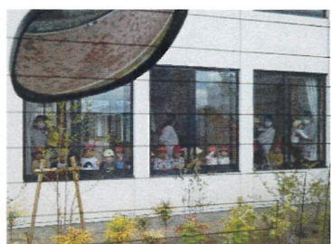
↑おはなさん・つぼみさんがお見送りしてくれました。