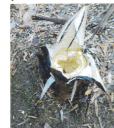
↑動物が食べた後のたけのこ