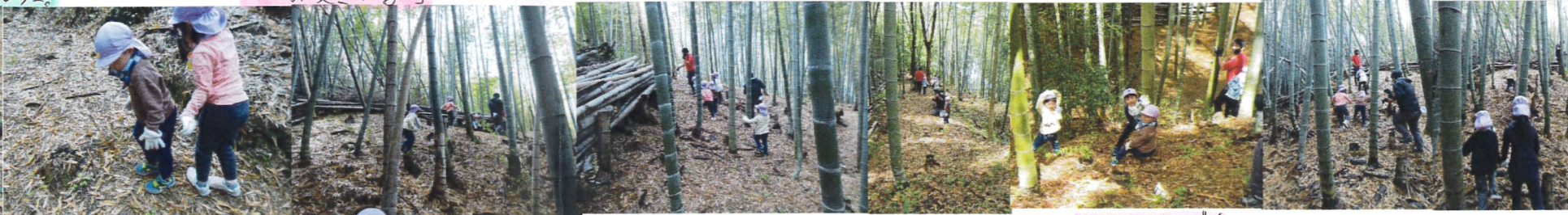
↑どんどん山の中へ