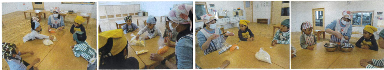
みんなで材料の確認。筍、人参、油あげ。