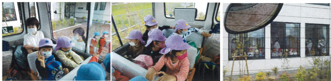
ワクワク・ドキドキ 今から出発です!