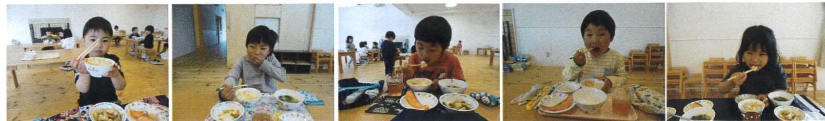
いただきます。あたたかくてホクホクしながら食べました。