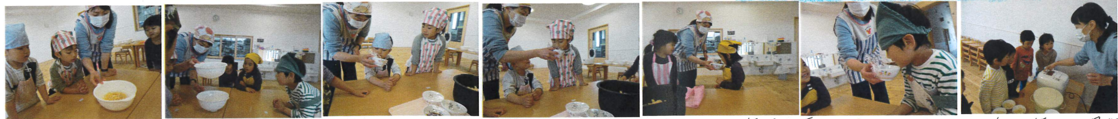
調味料の確認。酒としょう油のにおいとかいだけり、塩と三温糖と味見したよ。