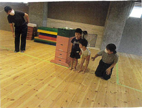
死角の場所の見え方の 確認をしています。