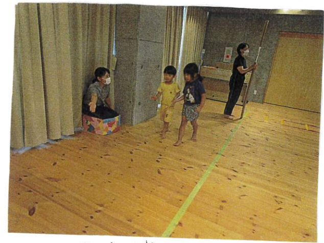
「ジャンパーモンク」などの出口にも 注意 △ 運転手さんとアイコンタクト!