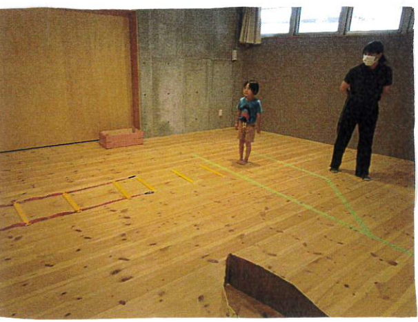
青になってもすぐには行かず 「右・左・右、おけー。」