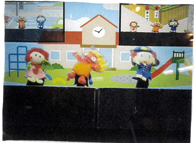
いばらまーちゃんと茨木童子くんの 人形劇 ↑↑