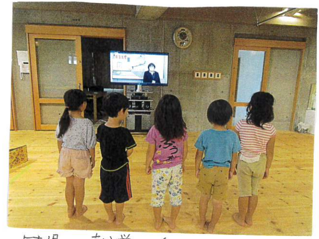
5才児は就学に向け、さらに 難しい内容で交通ルールについて 学びました。